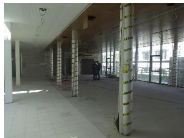
Arbeiten im Eingangsbereich