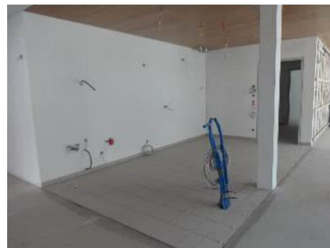
Teeküche in den Etagen