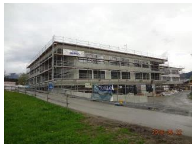
Der Rohbau ist fertiggestellt

Die Arbeiten im Wohn- und Pflegeheim laufen auf Hochtouren, damit am 1. Oktober 2014 die ersten Bewohner einziehen können.